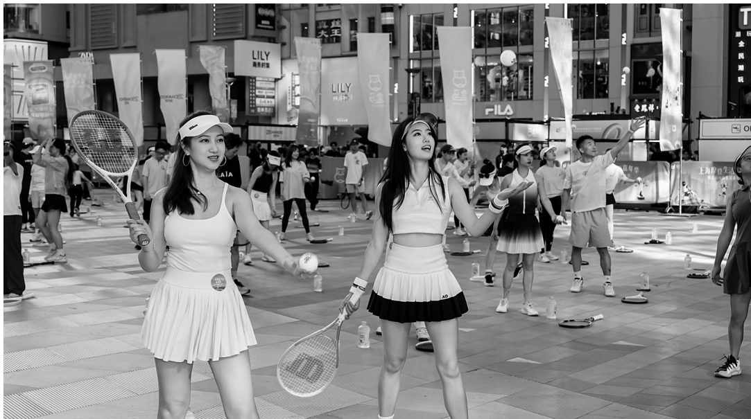
2026上海摩登生活嘉年华暨上海瑜伽生活嘉年华现场。

南京路步行街世纪广场迎来一场都市盛会。2026上海摩登生活嘉年华暨上海瑜伽生活嘉年华正式拉开帷幕。活动以“瑜伽+”为核心，依托上海“六六夜生活节”的城市消费节点，打造集运动潮流、AI智能、时尚消费于一体的复合型城市活动IP，将前沿科技与潮流生活方式深度融合，为初夏的申城注入全新活力。