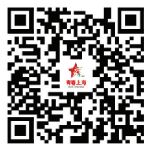
详见青春上海视频号