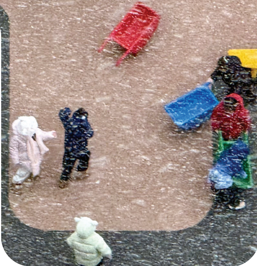
上海的天空飘起雪花。

据了解，本次强冷空气影响将持续到22日，过程最低气温出现在22日早晨，市区最低气温在零下1℃左右，有薄冰，郊区最低气温为零下6℃到零下3℃，有冰冻或严重冰冻。23日起本市转为地面高压控制，天气转晴，气温将有所回升。青年报记者 刘秦春