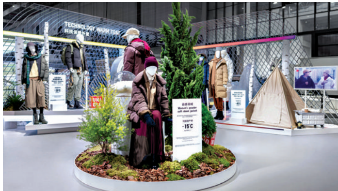
优衣库“暖心之旅”主题展台。