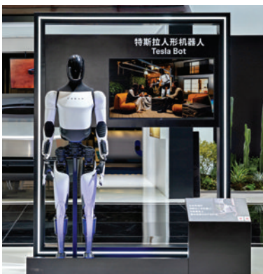
特斯拉人形机器人。

与Cybercab同台展出的还有两台特斯拉人形机器人。这些与电动车技术同源的机器人共享摄像头、三电技术以及端到端神经网络技术，它们可以自主完成清洁桌面，用吸尘器清扫地面，