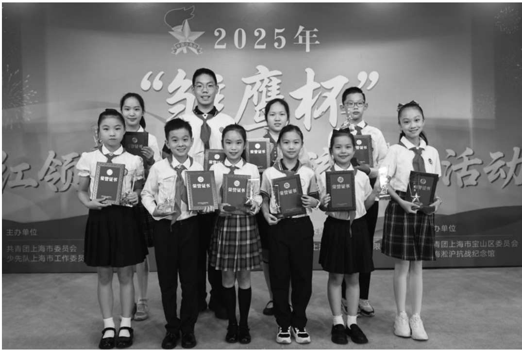
“雏鹰杯”红领巾讲解员交流展示活动一等奖获得者合影。

上海市少工委主任、市少先队总辅导员赵国强在讲话中说，本次活动“打开了一扇窗”，仿佛让队员们来到了80年前的场景，