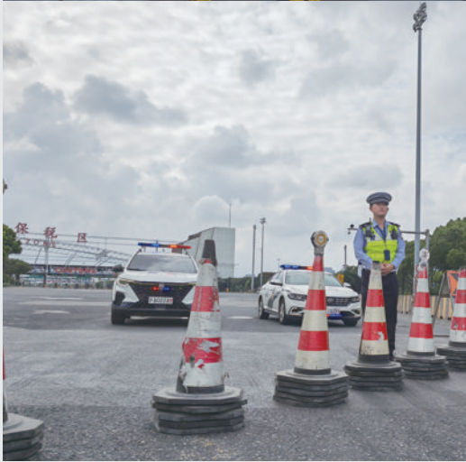
上海青年逆风而行、全力守护,他们奔波在各大安置点现场,忙碌于排查隐患,全力保障人民群众生命财产安全。