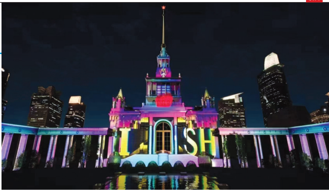
主会场上海展览中心投影秀效果图。