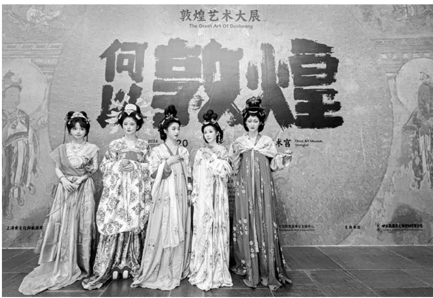
“何以敦煌”敦煌艺术大展。

当然《黑神话·悟空》作为一个游戏产品,除了达成美好愿景,其产品还要经受玩家的检验,不断完善。文化出海,不是一朝一夕的事,不是一个筋斗云就能飞出十万八千里,而是要经历九九八十一难,跋山涉水。文化出海也不能仅仅靠一两个爆款破圈的产品就能颠覆认知,需要更多精品不断涌现,滴水石穿。希望更多文化创造如这只神猴破石而出,乘风出海,闯出个“西游”盛世。