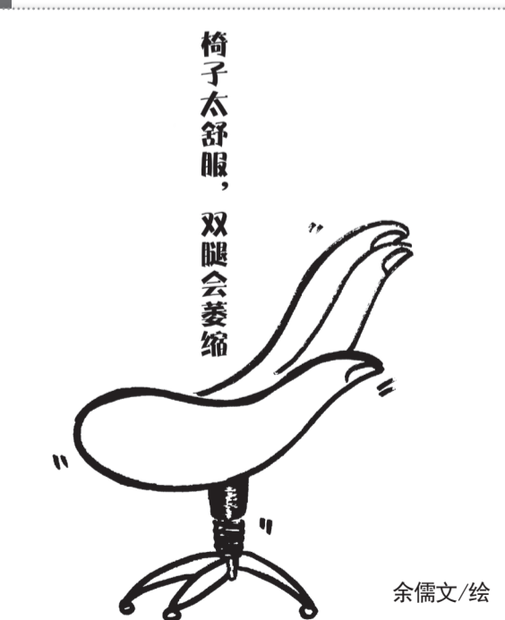
椅子太舒服，双腿会萎缩