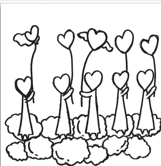
同一目标，同一过程，带来不同的人生