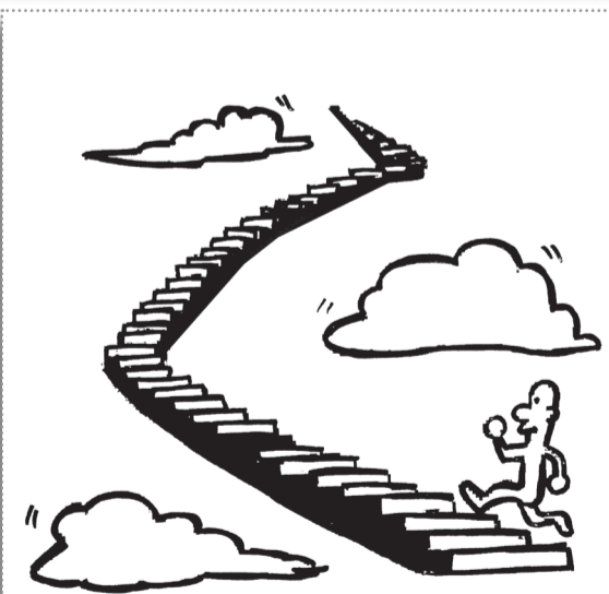
伟大的成功不是一蹴而就，必须学会分解，逐步实施