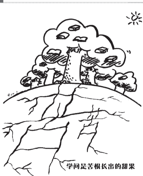
学问是苦根长出的甜果