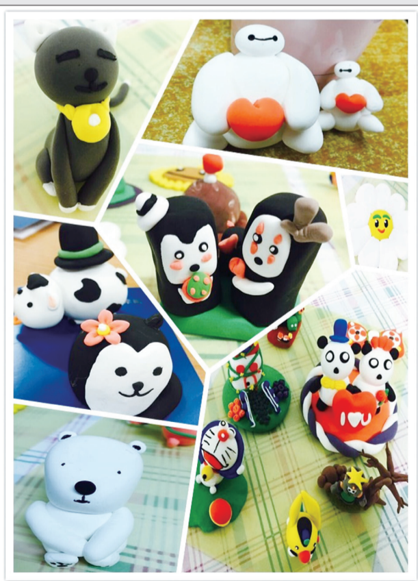
中华职校 DIY手工制作(泥塑)

在“原创”版,无论是写作、书法、绘画,抑或手工制作、摄影作品……一切可以用文字和图片展示的原創作品,都可以在这里尽情展现。我们也非常欢迎老师和家长的热情来稿,您可以: