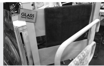
为毛巾加热的玻璃架

想过冬天洗完澡怎么让自己更暖和么？除了空调暖气之外，现在还有一种方法是给毛巾“热热身”。一款名为Glass Tower Warmer的毛巾加热支架就能解决这个问题，加热部分前后都是通过玻璃材质传导，我实际摸了一下并不算太烫手，平时用来晾毛巾或者用热毛巾敷脸会有一些效果。