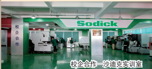
校企合作—沙迪克实训室

4. 凡成绩优秀的学生特选送参加学校组织的赴新加坡、韩国、日本、台湾等地的国际交流。