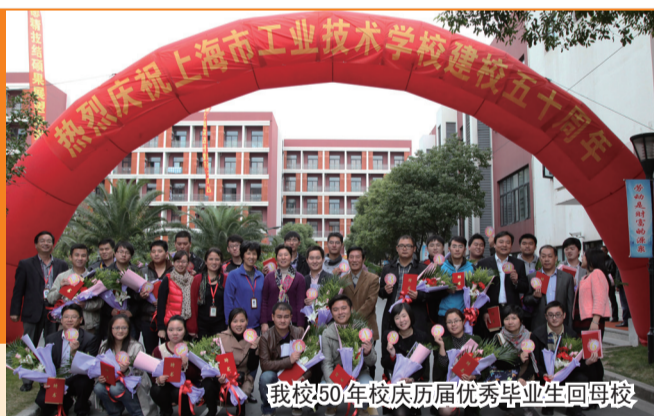
我校 50 年校庆历届优秀毕业生回母校