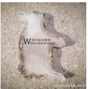
部分优秀学生作品