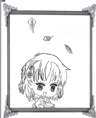
作者/沈彦娇 学校/崇明县实验中学