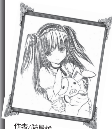
作者/陆晨悦 学校/奉贤区南桥镇实验中学