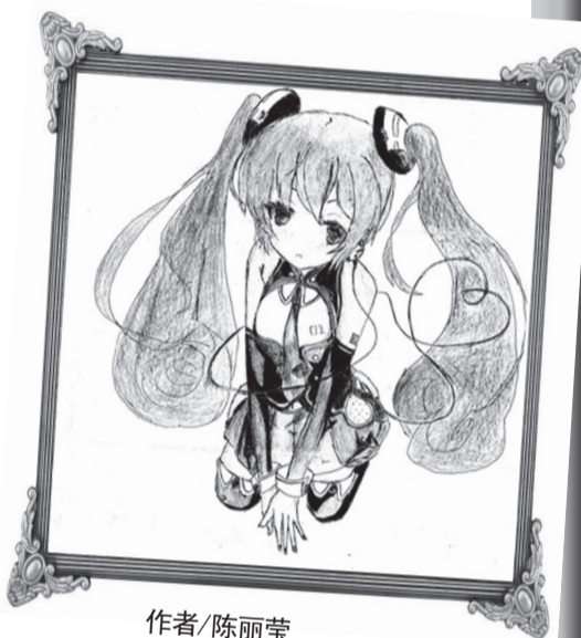
作者/陈丽莹 学校/兴陇中学