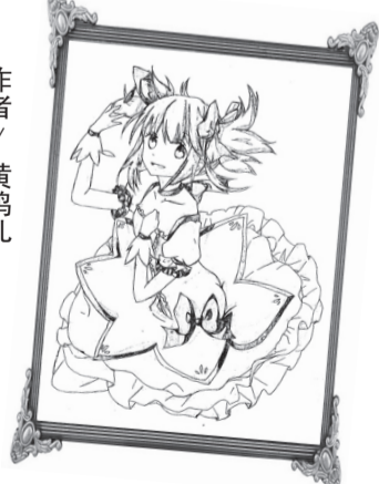
作者/黄鸣儿 学校/金山中学