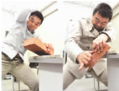
菠萝U奖——川大教授劈砖