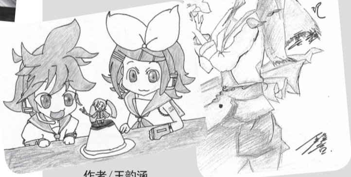
作者/王韵涵 学校/李惠利中学