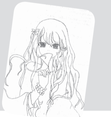
作者/樊森婷 学校/崇明县实验中学