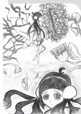
作者/陆天意 学校/崇明县实验中学