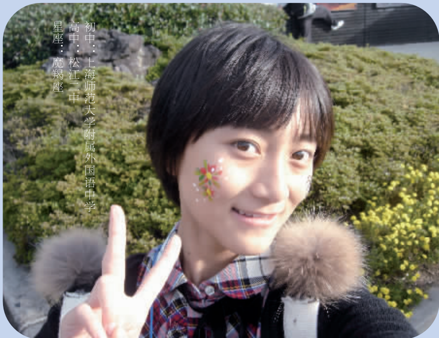
初中:上海师范大学附属外国语中学 高中:松江二中 星座:魔羯座