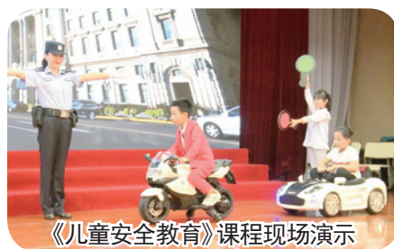
《儿童安全教育》课程现场演示

“安全”课程;二年级引进“根与芽”课程;三年级由学校组织开发“小学生职业启蒙教育”课程;四年级开发了“有趣的旗帜”等,均借助家校共育平台打造,满足学生的个性化需求。