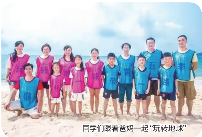
同学们跟着爸妈一起“玩转地球”

“安全”课程;二年级引进“根与芽”课程;三年级由学校组织开发“小学生职业启蒙教育”课程;四年级开发了“有趣的旗帜”等,均借助家校共育平台打造,满足学生的个性化需求。