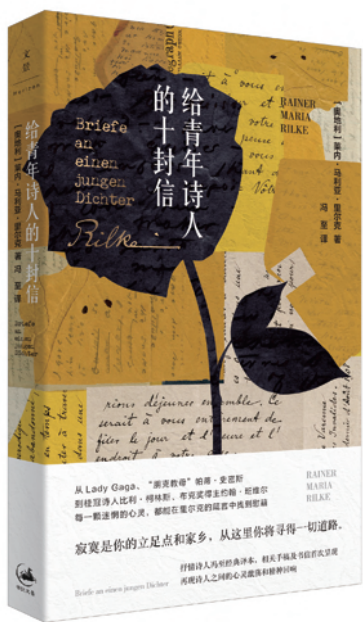
摘自《给青年诗人的十封信》

你在信里问你的诗好不好。你问我。你从前也问过别人。你把它们寄给杂志。你把你的诗跟别人的比较；若是某些编辑部退回了你的试作，你就不安。那么（因为你允许我向你劝告），我请你，把这一切放弃吧！