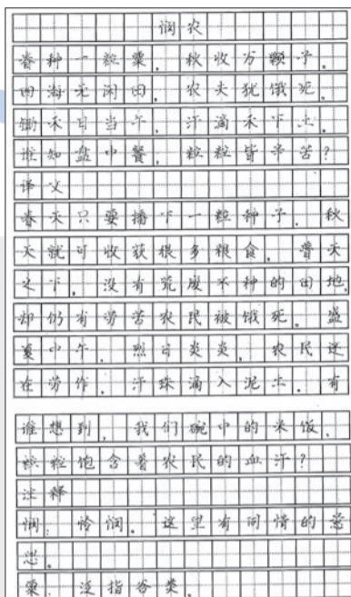
▲静安区扬波外国语小学 二年级 顾芮绫