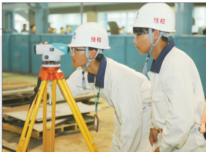
▲摄影“学海无涯,他们勤作舟楫”

说明:本作品拍摄的是中职组女篮比赛,持球队员在作出选择的一瞬间。一名球员在外线持球,对方高中锋贴身紧逼上来防守,己方一名队员出来策应。作品的构图合理,在一瞬间的态势中,持球队员的表情捕捉到位。