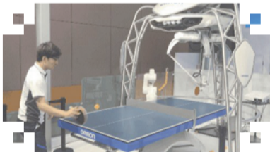
最灵巧的乒乓球陪练机器人

人们口中的4K高清显示,在“进博会”的展台上已升级至8K。惊人的分辨率让人分辨不清画面和现实。“栩栩如生”这个成语,又有了一个生动的诠释。