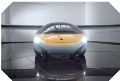
最科幻的3分钟变身的“飞行汽车”

这台会打乒乓球的机器人,能根据不同对手调节“段位”,从世界级到小区级,都能和你大战三百回合。和机器人打球可太累了,赢一球真不容易啊。