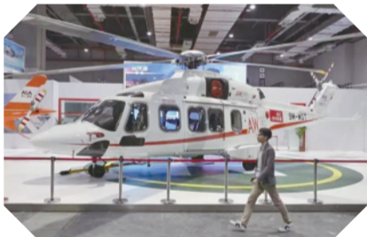
最昂贵的莱奥纳多直升机

最 智能、最科幻、最庞大、最好吃……让我们一起去看看中国国际进口博览会上那些酷炫商品吧,这些仅是进博会的冰山一角,在未来的某一天,它们或许能走进我们的日常生活。