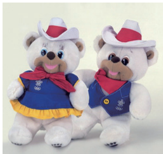
1988年加拿大卡尔加里冬季奥运会吉祥物“Hidy”和“Howdy”，吉祥物由两只拟人化的北极熊组成，名字传达出加拿大人的热情与欢迎(Hi, Hello)。

日本选择了两只具有“超自然力量”，且类似狐狸的未来生物作为东京奥运会吉祥物。组委会介绍称，蓝色的夏季奥运会的吉祥物不仅具备超能力，还可以移动到世界上的任何地方。而残奥会吉祥物则是一个拥有热爱自然之心的粉色吉祥物。