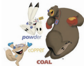
2002年美国盐湖城冬季奥运会吉祥物雪靴兔“Powder”、北美草原小狼“Copper”和美洲黑熊“Coal”。吉祥物代表了奥林匹克运动会更快、更高、更强的格言。