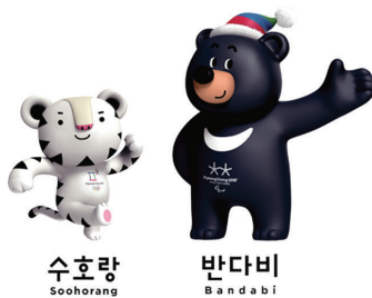
2018年平昌冬奥会吉祥物“Sohorang”和冬残奥会吉祥物“Bandabi”，白老虎被认为是神圣的守护兽，同时，白老虎的颜色也象征着冰雪体育运动。熊是坚强意志与勇气的象征，而亚洲黑熊也是江原道的代表性动物。