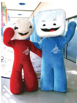
2006年意大利都灵冬季奥运会吉祥物“内韦”和“格利兹”。它们象征着冬季奥运会项目中不可缺少的两种元素——雪和冰。

1994年挪威利勒哈默尔冬季奥运会吉祥物“Hakon”和“Kristin”，吉祥物来自挪威童话故事的两个主角，使得这届奥运会的吉祥物充满故事性。