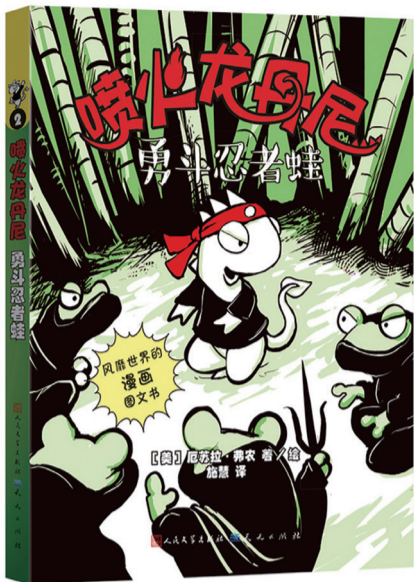
作者:[美]厄苏拉·弗农 著/绘 出版社:天天出版社