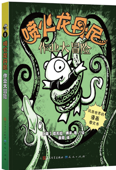
作者:[美]厄苏拉·弗农 著/绘 出版社:天天出版社