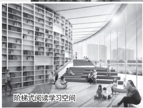
阶梯式阅读学习空间