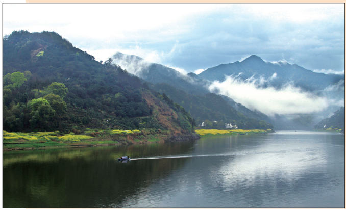
摄影《那山、那水、那云》 上海新闻出版职业技术学校 樊不凡 指导老师：郭宝宏、夏冯