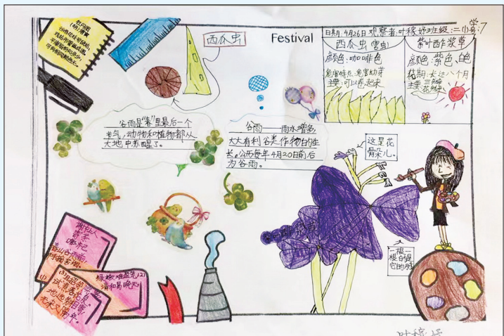
《观察日记之谷雨》 建青实验学校二(1)中队 范俊逸