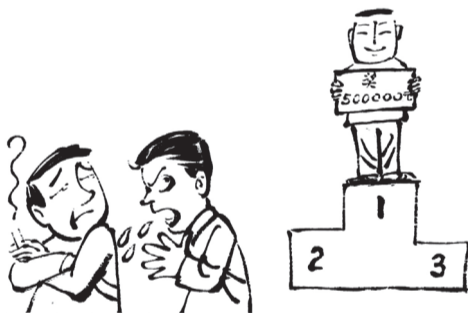
当你红得让人流口水时， 关于你的口水也会多起来