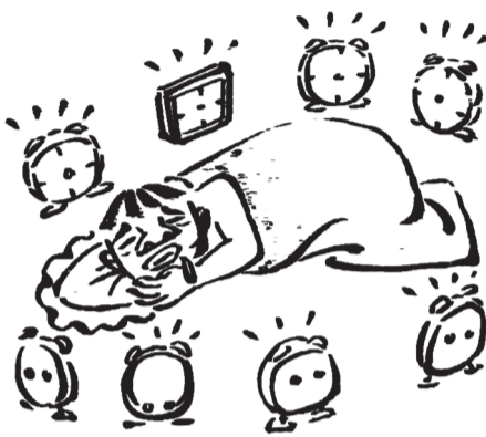
再多的闹钟也叫不醒 一个没有梦想的懒汉