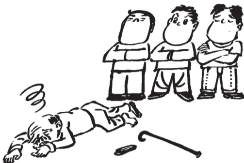
新时代下的“敢扶不敢为”