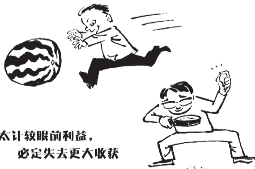
太计较眼前利益， 必定失去更大收获