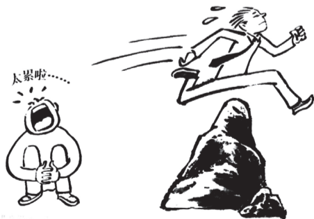
成功者的行动在腿上，失败者的行动在嘴上