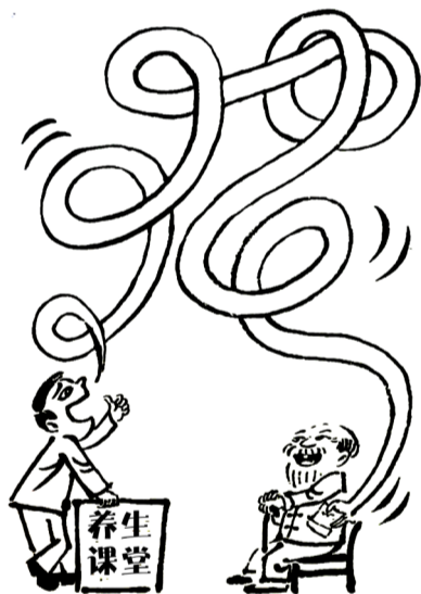
吹嘘的最终目的就是钱财