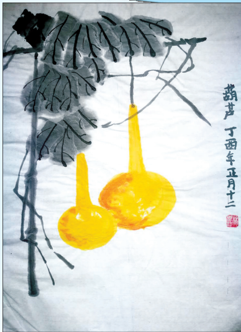
▲《葫芦》 黄浦区中华路第三小学 五(二)中队 林昊骏