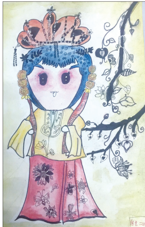
▲《花旦》 金鼎学校一分校 二(1)中队 陈艺

我喜欢上了书法,课余时间我也会静心练习。“我家洗砚池边树,朵朵花开淡墨痕。不要人夸颜色好,只留清气满乾坤。”我深深地懂得,要想学好书法,唯有勤奋,唯有坚持。