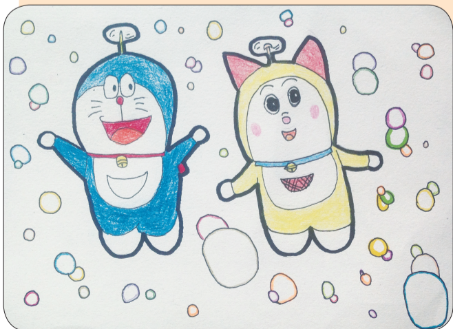
▲《机器猫兄妹》 曹杨二中附属学校 三(3)中队 沈文宣