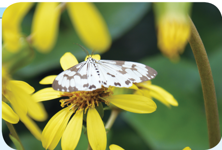
▲《蝶恋花》 丰镇第一小学 四(2)中队 郝天阔