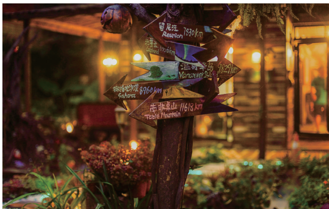
通往回忆之路的指示牌。