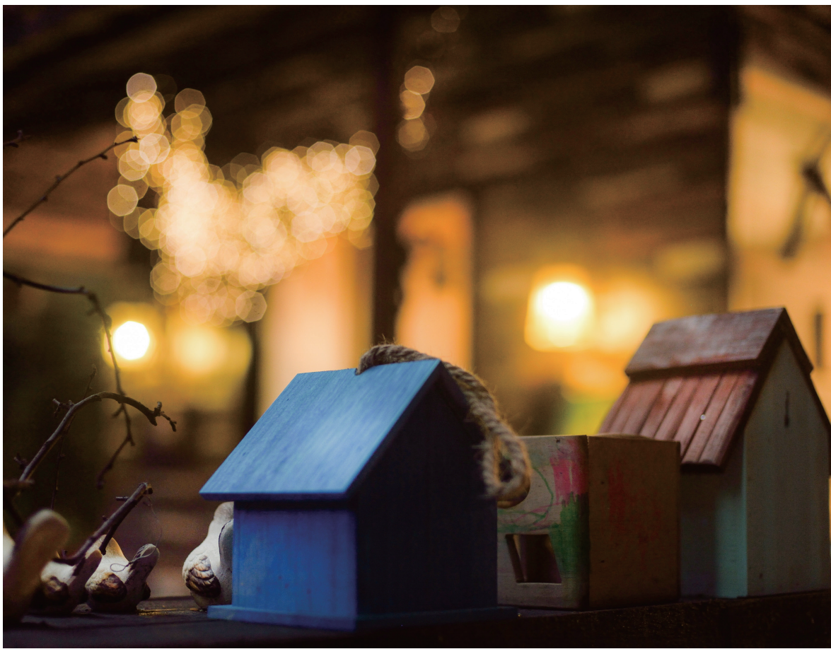
童话般的花园一到晚上更散发神秘的色彩。