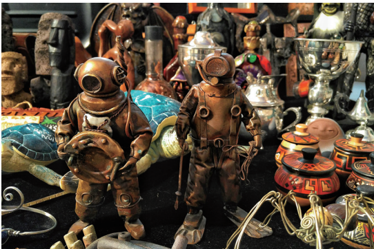
从世界各地带回的“孤品”宝贝。

念。客厅里还有一面墙，贴着一张巨大的世界地图，地图上密密麻麻地做了标记，那些都是他曾去过的地方。