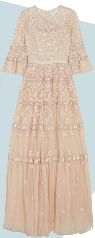
NEEDLE &amp; THREAD