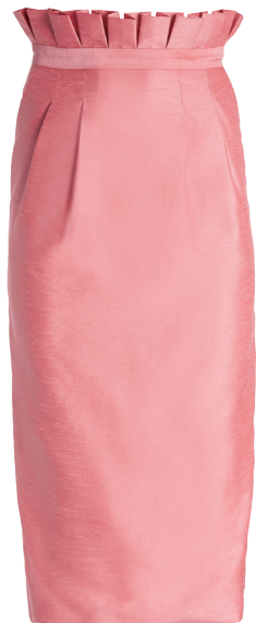
alice + olivia