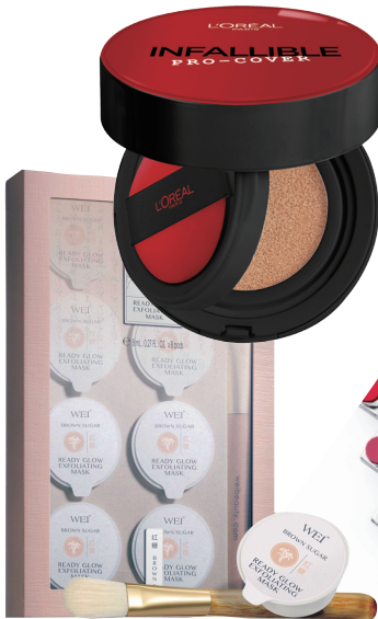
蔚蓝之美双重亮肤糖面膜 RMB380/8ml