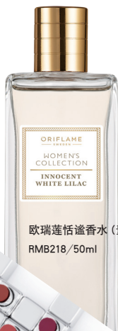
欧瑞莲恬谧香水（素雅丁香） RMB218/50ml