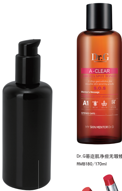
Dr.G蒂迩肌净痘无瑕修护液 RMB180/170ml