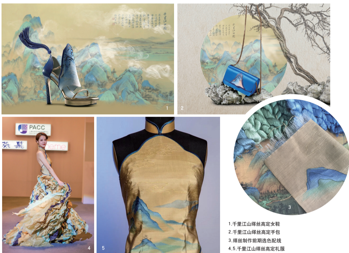
1. 千里江山缂丝高定女鞋 2. 千里江山缂丝高定手包 3. 缂丝制作前期选色配线 4. 5. 千里江山缂丝高定礼服

故宫有一件珍贵的文物《千里江山图》，这是18岁宋代天才少年王希孟在宋徽宗的亲自指导下完成的旷世长卷。宋代美学之清雅隽永就这样停留在11.95米长卷中，青绿山峦连绵起伏，万顷碧波烟波浩渺，倾倒无数文人墨客。