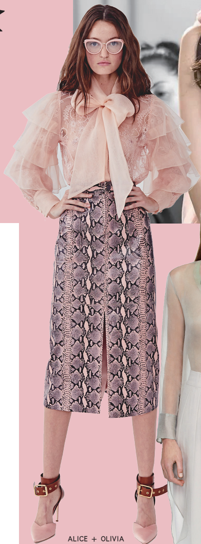
ALICE + OLIVIA