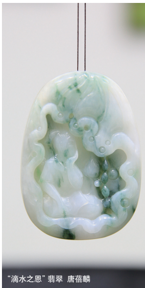
“滴水之恩”翡翠 唐蓓麟