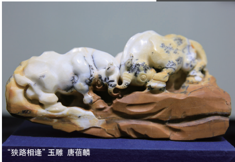
“狭路相逢”玉雕 唐蓓麟