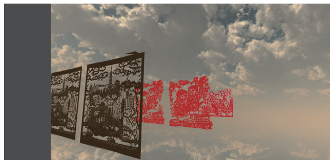
“林曦明现代剪纸艺术馆”海派剪纸VR项目 纪晓燕