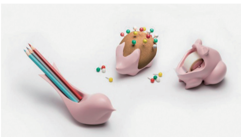
Table Zoo 创新文具系列

LA Chair是为造作设计的一系列基础款椅子,包含曲木和软包两个版本。背与腿似字母L与A的造型。其中流畅的L型的座面在表达线条感同时亦符合人体工学,从而保证了久坐的舒适;而形似A的腿部结构不但使得椅子可堆叠,两边的把手也暗示着椅子可被轻松移动。