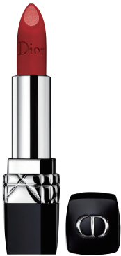
DIOR烈艳蓝金唇膏 双色双效·色号999