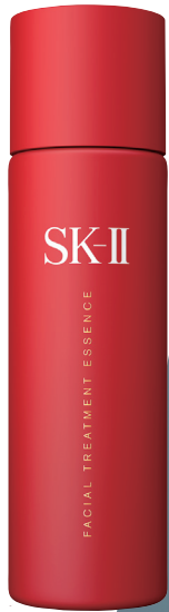
SK-II护肤精华露新年限量版