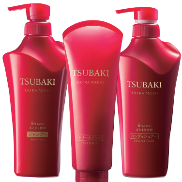
TSUBAKI丝蓓绮新年红系列