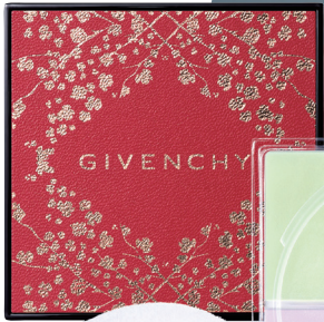
GIVENCHY BEAUTY 2018新年限量四色散粉