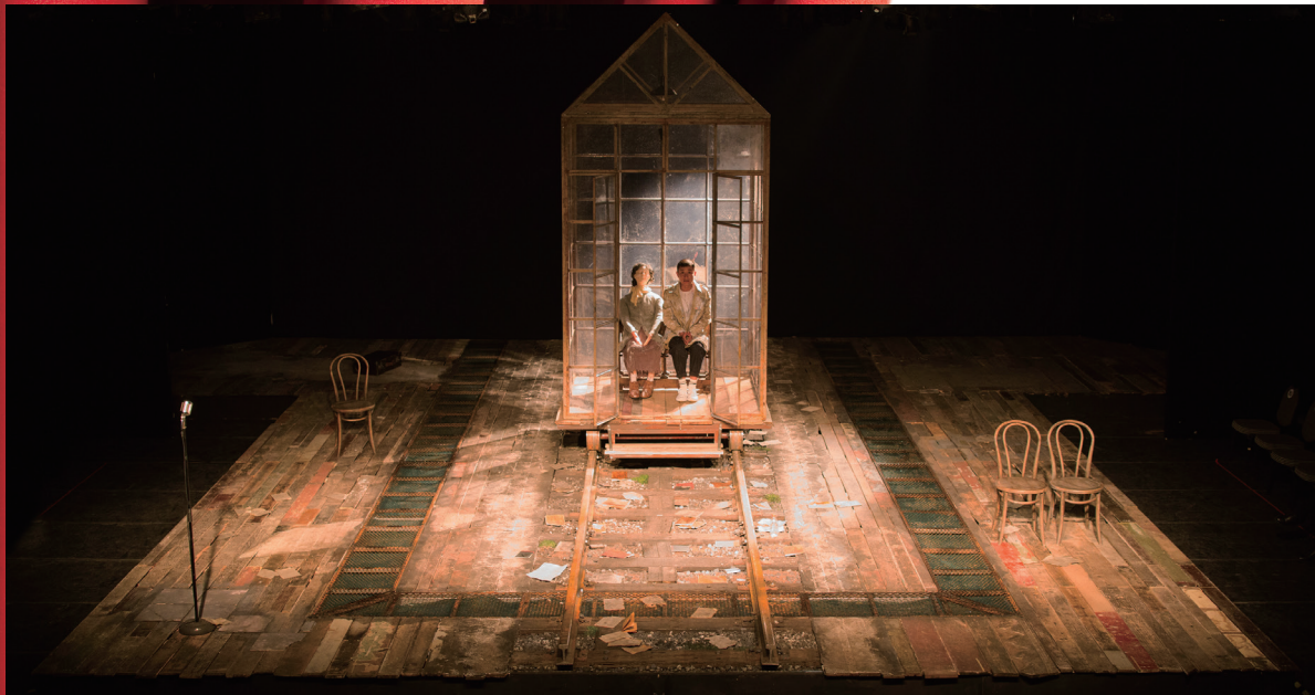
《每一件美妙的小事》剧照