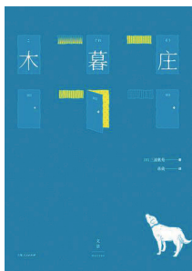
《木暮庄》 作者:[日]三浦紫苑 出版社:上海人民出版社 出版年:2017年11月 推荐指数:★★★★★

木暮庄,这么个可爱的名字其实是一幢古旧木造公寓,共有六间房,庭院里养有毛色不明的狗。居民和周围的人是主人公,并将在七个章节里来展开故事,而这些故事的共同主题是“爱”。