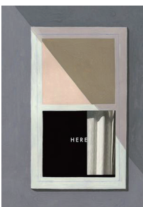
《这里》 作者:[美]理查德·麦奎尔 出版社:后浪|北京联合出版公司 出版年:2017年10月 推荐指数:★★★★★

《这里》是一座房子。封面上就是通向它的窗口。而当我们翻开书页,整个房间就向我们展开。越来越多有关时间的谜逐渐显露,有些甚至在作者麦奎尔的意料之外。所以,“这里”其实是由空间与时间共同舞蹈的一曲瑰丽华尔兹。