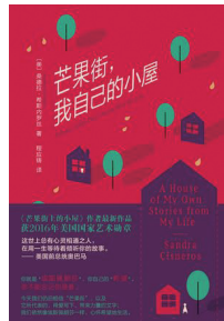
《芒果街,我自己的小屋》 作者:[美]桑德拉·希斯内罗丝 出版社:南海出版公司 出版年:2017年10月 推荐指数:★★★★★

从前有个女孩,她叫埃斯佩朗莎。这个名字,意思是“希望”。有人曾问作者,你就是埃斯佩朗莎吗?作者说,也许是,也许又不是,因为每个小伙伴心中,其实都居住着一个埃斯佩朗莎。“埃斯佩朗莎,你还好吗?”因为内心有力量,所以落笔有声音。从《芒果街上的小屋》到《芒果街,我自己的小屋》,你或许已经发现了作者的突破。