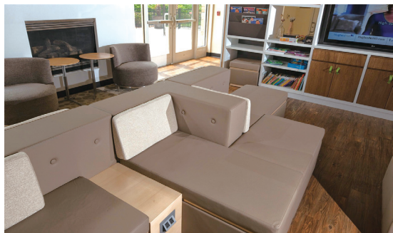
假日酒店: 建立社交中心

上海市青年创意人才协会 Shanghai Creative Youth Talents Association