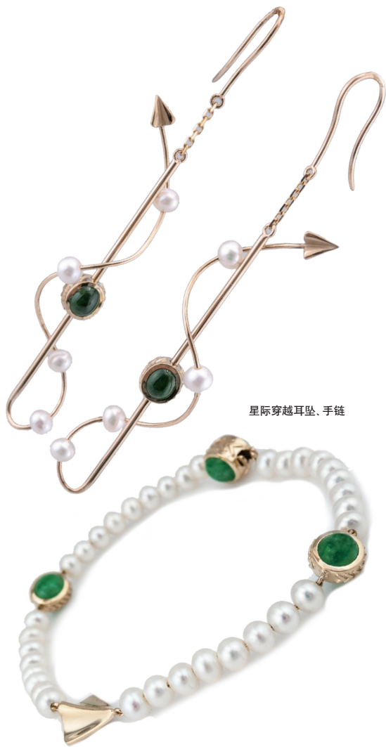
星际穿越耳坠、手链