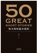
《50: 伟大的短篇小说们》 作者: 果麦 出版社: 天津人民出版社

收录世界四大短篇小说家: 欧·亨利、契诃夫、莫泊桑、马克·吐温的代表作, 还囊括了诺贝尔文学奖得主泰戈尔、海明威、福克纳等, 最大程度地还原原著之美, 展现大师们独到的叙事风格和技巧, 为你带来一场世界短篇小说的经典盛宴。