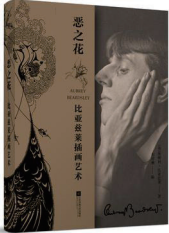
《恶之花: 比亚兹莱插画艺术》 作者: 比亚兹莱/韦君琳 出版社: 江苏凤凰文艺出版社

1929年,鲁迅编印了《比亚兹莱画选》,署“朝花社选印”,并担纲了该书的封面设计。在为该书所作的引言里,鲁迅称比亚兹莱“生命虽然如此短促,却没有一个艺术家,作黑白画的艺术家,获得比他更为普遍的名誉;也没有一个艺术家影响现代艺术如他这样的广阔”。