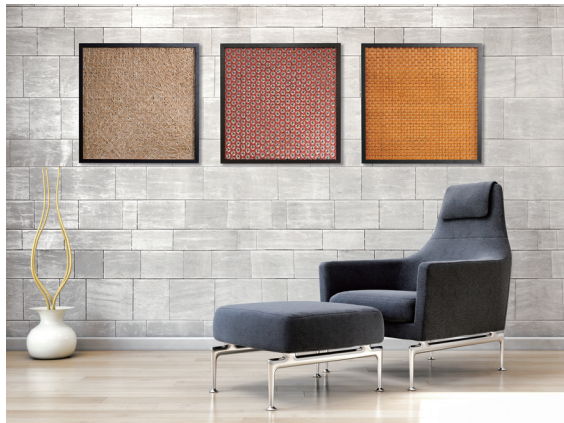
竹编万花筒的单体模块适合家居空间

传统竹编图案是根据竹篾的宽窄厚薄、编织交叉角度和数量、竹篾之间留下的空隙、竹篾存放年岁产生的深浅, 产生出千变万化的图案可能性。竹编万花筒单体模块融合了中国12种镂空竹编经典编法。东阳竹编的纹样包括铜