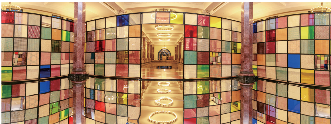
流光溢彩的竹编万花筒公共艺术装置