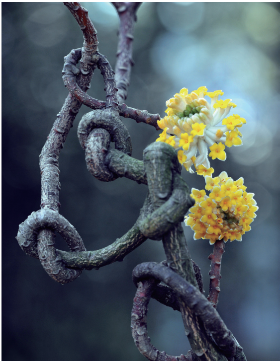
经历曲折后的重逢