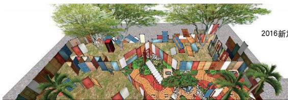
2016新加坡设计周系列活动

设计的最终目的是解决社会问题, 这也是布迪漫成立亚洲创意产业联盟, 启动全球华人创新大赛的原因。在设计师的身份之外, 布迪漫更以关切之心, 思考着设计能为人们实际生活带来什么样的助益。“缺乏社会、生活阅历, 就贸然出来所做的创新, 肯定会造成某方面的欠缺。”在万众创业、万众创新的当下, 如何用积极的方式以商创文, 创造真正有意义的设计, 任重而道远。