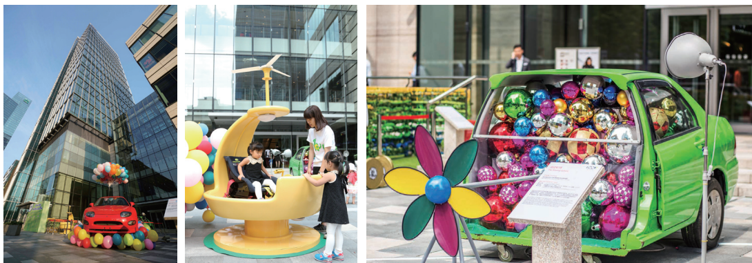
2015上海设计之都活动周“1001爱·生活”可持续x设计系列活动