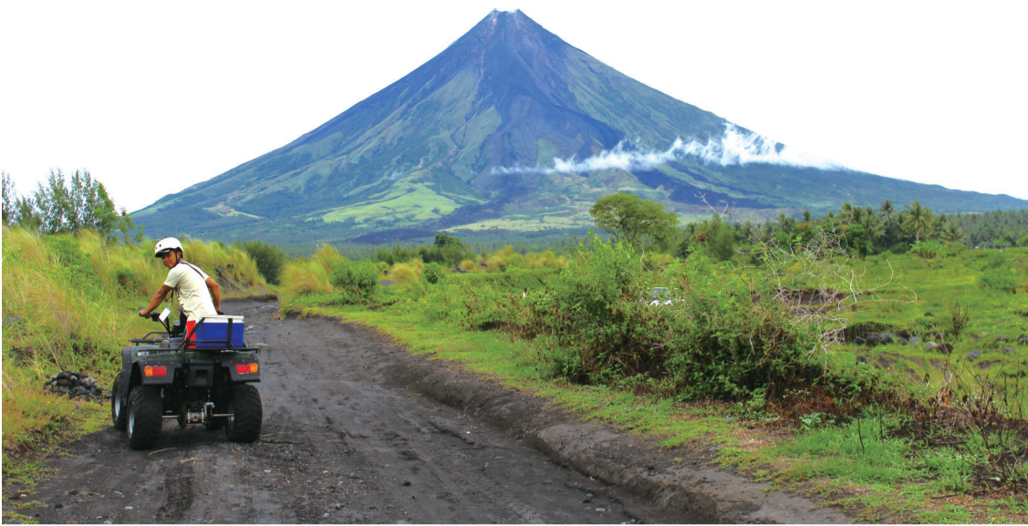
ATV四驱车直击马荣火山,感受翻山越岭的畅快刺激。

马荣火山对于黎牙实比来说永远都是一个传说,尽管其经年累月时有爆发,但也正因如此更显其平日的秀美宁静。