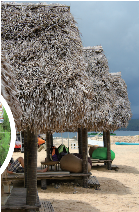
极具当地风情的茅草屋。