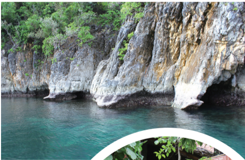
清澈见底的海水总是令人心旷神怡的。

回到水面上,黎牙实比的海上游乐项目更是层出不穷,香蕉船、海上独木舟、海上风帆等等,都能让你体验到水面上的速度与激情。