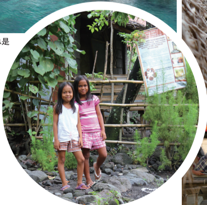
偶遇小村民,笑容非常具有感染力。