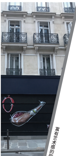
富有艺术感的街头涂鸦