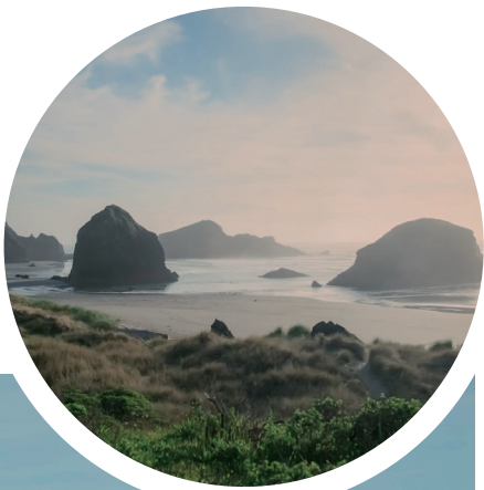
俄勒冈州101公路沿海景色