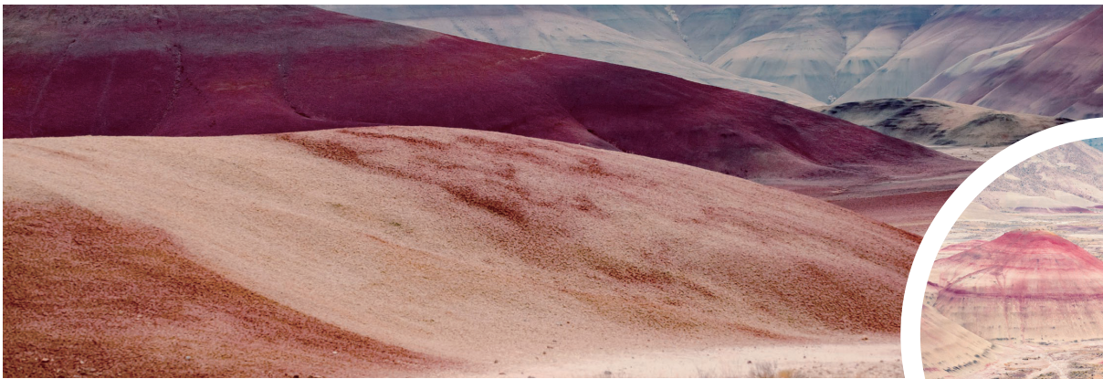
近距离观赏彩绘山